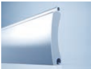
heroyal RD 75