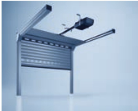
heroal Deckentor mit Mittelantrieb

Bei Garagen mit geringer Sturzhöhe ist das Deckentor heroal OD 75 die erste Wahl. Beim Hochfahren werden die Stäbe nicht im Blendkasten aufgewickelt, sondern fahren flächig unter die Decke. Je nach Einbausituation kann in kleinen Garagen mit geringem Sturz ein platzsparender Seitenantrieb oder in Garagen mit Toröffnungen bis zu 4 x 4 m ein Mittelantrieb montiert werden.