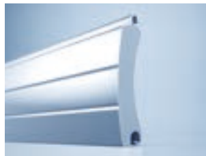
heroyal RD 75 TL