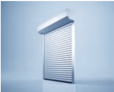
Rolltor heroal RD 55 mit geschlossener Montage

Bei Garagen mit geringer Sturzhöhe ist das Deckentor heroal OD 75 die erste Wahl. Beim Hochfahren werden die Stäbe nicht im Blendkasten aufgewickelt, sondern fahren flächig unter die Decke. Je nach Einbausituation kann in kleinen Garagen mit geringem Sturz ein platzsparender Seitenantrieb oder in Garagen mit Toröffnungen bis zu 4 x 4 m ein Mittelantrieb montiert werden.