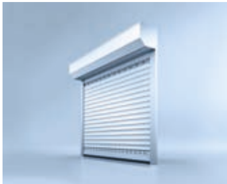
Rolltor heroal RD 75 mit geschlossener Montage

Das Rolltor heroal RD 55 ist für kleine bis mittlere Garagenöffnungen geeignet – die Ausführung mit mehr Design und Ausstattungsoptionen, das heroal RD 75, auch für Garagenöffnungen bis 6 m Breite . Beide Systeme können offen montiert werden, um Platz zu sparen oder geschlossen mit Blendkasten. Dieser kann innen oder außen angebracht werden.