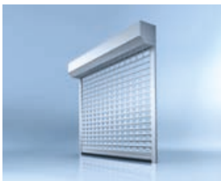
heroal Rolltor mit Rollgittern

Das Rolltor heroal RD 55 ist für kleine bis mittlere Garagenöffnungen geeignet – die Ausführung mit mehr Design und Ausstattungsoptionen, das heroal RD 75, auch für Garagenöffnungen bis 6 m Breite . Beide Systeme können offen montiert werden, um Platz zu sparen oder geschlossen mit Blendkasten. Dieser kann innen oder außen angebracht werden.