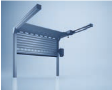
heroal Deckentor mit Seitenantrieb