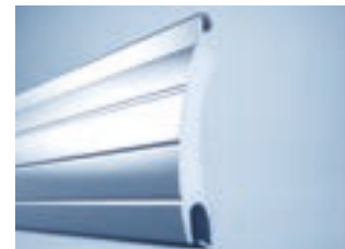
heroyal RD 55

Sie haben die Wahl: Sicht-, Gitter- oder Lüftungsprofile sorgen für eine stärkere Belüftung, einen höheren Lichteinfall oder besondere Stabilität. Für eine geschlossene Fläche steht Ihnen der puristische Stab heroyal RD 75 in moderner Optik ohne Rillen oder der heroyal RD 75 TL (Trend Lines) in Rollladenoptik mit Rillen zur Verfügung. Eine schmale Deckbreite bietet der Stab heroyal RD 55 .