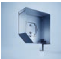
heroyal GKSE 230

Sie haben die Wahl: Sicht-, Gitter- oder Lüftungsprofile sorgen für eine stärkere Belüftung, einen höheren Lichteinfall oder besondere Stabilität. Für eine geschlossene Fläche steht Ihnen der puristische Stab heroyal RD 75 in moderner Optik ohne Rillen oder der heroyal RD 75 TL (Trend Lines) in Rollladenoptik mit Rillen zur Verfügung. Eine schmale Deckbreite bietet der Stab heroyal RD 55 .